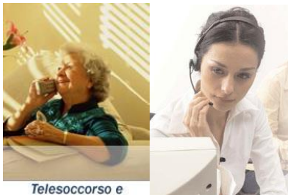
Telesoccorso e Teleassistenza

La centrale operativa chiama una volta alla settimana, in giorni e ore concordate con l'utente, per rendere il servizio più familiare, per parlare con lui e aiutarlo nei momenti difficili.